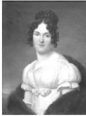
Portrait de femme, Henri-François Riesener