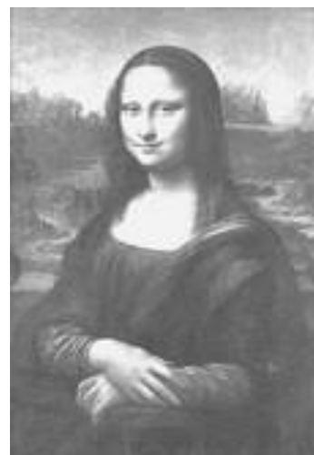
La Joconde, Léonard de Vinci