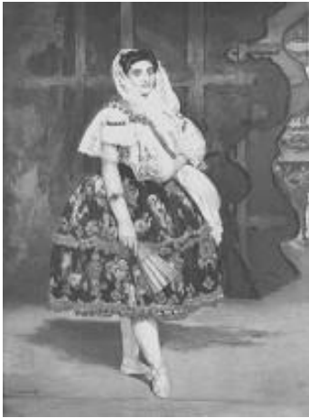
Lola de Valence, Edgar Manet