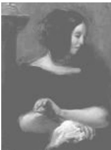
George Sand, Eugène Delacroix